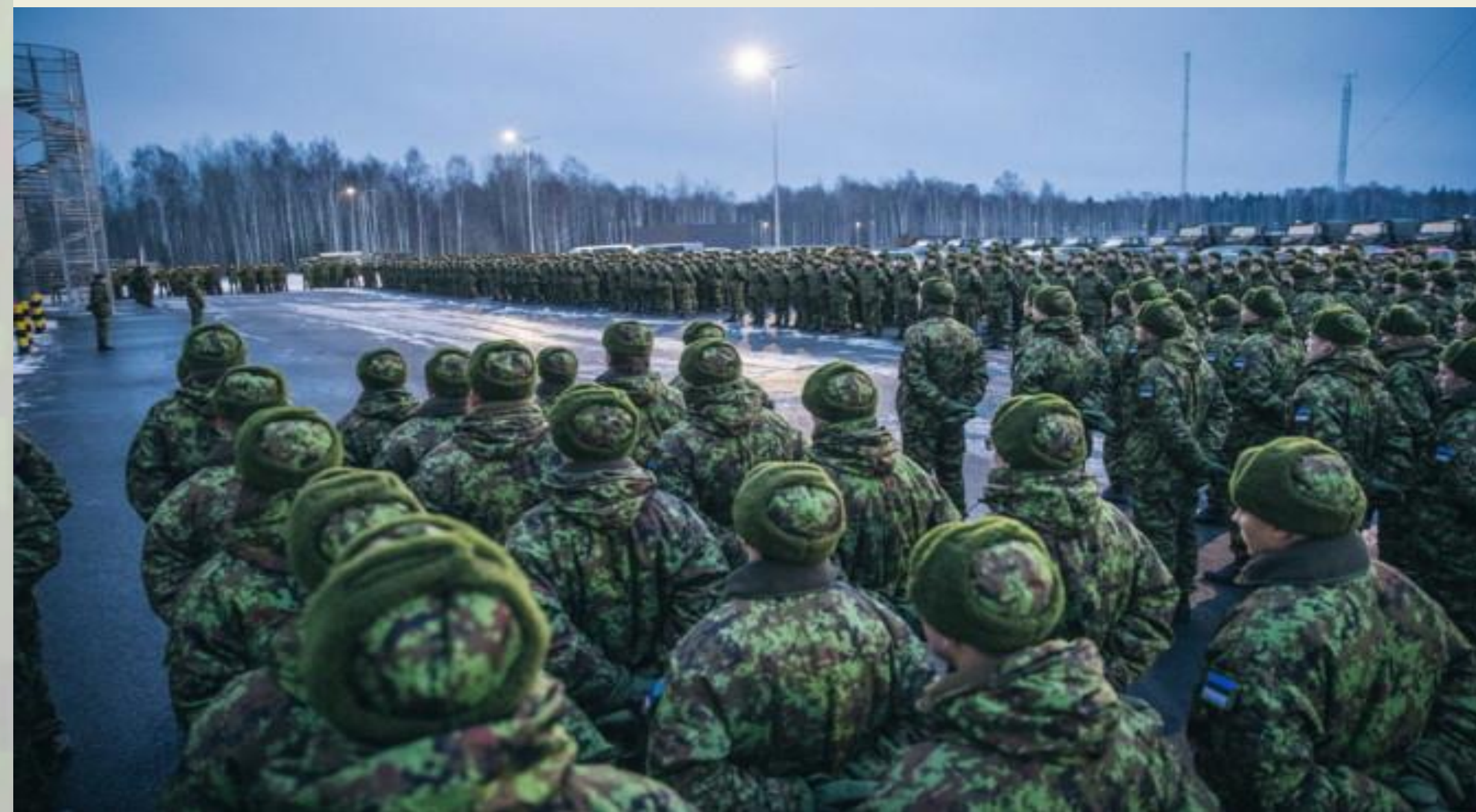
Reservväelaste osalemine õppekogunemistel 2010 - 2017