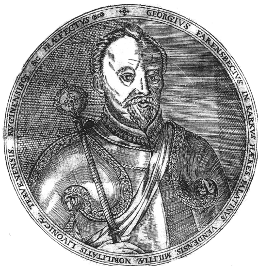
Joonis 2. Jürgen Farensbachi gravüür.

Kõik rahvad vajavad kangelasi. Eestlaste jaoks on üheks selliseks Jürgen Farensbach, kelle elu- ja teenistuskäiku on ülevaatlikult kajastatud käesolevas artiklis. Jürgen Farensbach oli sündinud Läänemaal, ta oli arvatavasti kohalikku päritolu, seega eesti juurtega aadlik. Ernst ja August Seraphimi järgi polnud ta eriti suur keeleoskaja, peale saksa keele valdas ta vaid eesti keelt. 193 Farensbach tegi küll pikaajalist koostööd poolakatega, kuid rääkis siiski saksa keelt ning oli usutunnistusest luterlane.