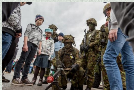
Juht noortele (rahvale)