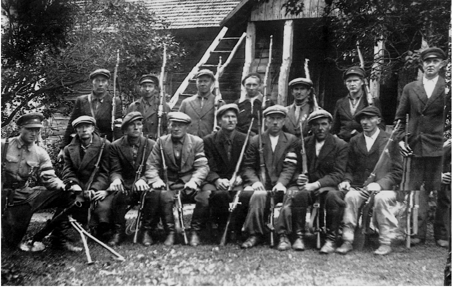
Pärnumaa metsavendade grupi liikmeid 1941. a Suvesõja päevil

on pigem seda eitav. Marksismil põhineva klassivõitluse alternatiiv oluks rahvasterviklus – ühiskondlik visioon, mida hiljem (pärast Konstantin Pätsi riigipööret) kasutati tihti ka Eesti riigi ametlikus retoorikas.